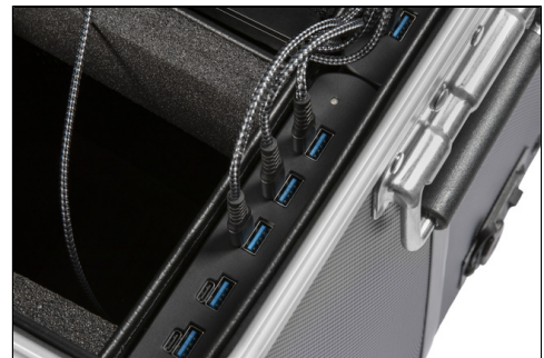
- 2 TwinCharge Module, automatische Einstellung der Ladeleistung und Anpassung durch USB-PD Power Delivery und QuickCharge Standards