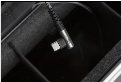
- Vorinstallierte im 90° abgewinkelte USB-C® Kabel